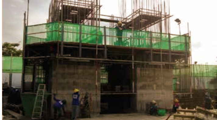
▲ ภาพงานโครงสร้าง Slip Form