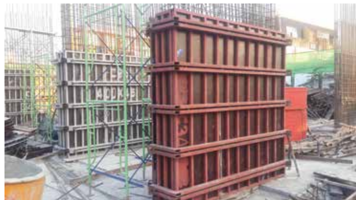
▲ ภาพงานโครงสร้างเสาชั้น 1