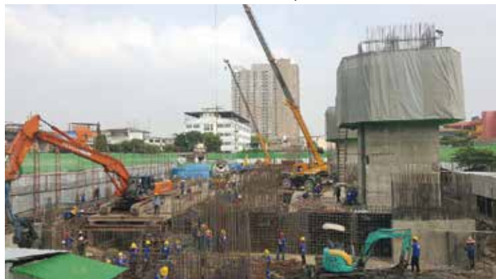
▲ ภาพงานโครงสร้างพื้นชั้น 1