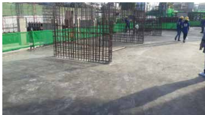
▲ ภาพงานโครงสร้างพื้นชั้น 1