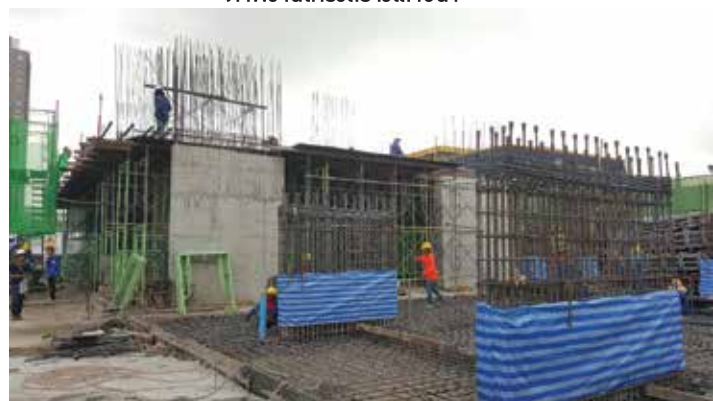
▲ ภาพงานโครงสร้างพื้นชั้น 2