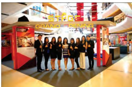
The Stage grand opening

บริษัท เรียลแอสเสทฯ ร่วมลงนามสัญญาก่อสร้างโครงการ The Stage Taopoon-Interchange คอนโดมิเนียมสูง 36 ชั้น จำนวน 773 ยูนิต มูลค่าโครงการกว่า 2,200 ล้านบาท กับบริษัทชินเท็คคอนสตรัคชั่นซึ่งก่อนหน้านี้ได้ผ่านการพิจารณาอนุมัติ ผลกระทบสิ่งแวดล้อม (EIA) เป็นที่เรียบร้อยแล้ว บริหารและควบคุมงานก่อสร้างโครงการโดยบริษัท นาราคอนซัลท์ แอนด์ ดีไซน์ จำกัด คาดว่าจะทำการก่อสร้างแล้วเสร็จในปลายปี 2560 สามารถเยี่ยมชมห้องตัวอย่างที่สำนักงานขายโครงการ The stage ได้ทุกวัน หรือติดต่อเพื่อขอรายละเอียดเพิ่มเติมได้ที่เบอร์ 088-004-5551