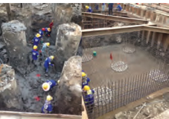
▶ งานตัดหัวเสาเข็มเจาะเพื่อทำฐานราก