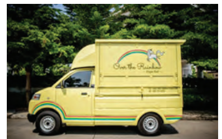
The Stage จัด Food Truck อินะระเส เอาใจชีวิตคนเมือง

บรรยากาศครั้งแรกกับการยกห้องตัวอย่าง 1 ห้องนอน ขนาด 26 ตารางเมตร มาไว้กลางห้างสรรพสินค้าใจกลางเมืองเมื่อ 16-22 กรกฎาคม 58 บริเวณชั้น 1 เซ็นทรัลลาดพร้าว เปิดจองห้องชั้นสูงวิวดวงมอเห็นรัฐสภา ราคาเริ่มต้นเพียง 2.57 ล้านบาท พร้อมเฟอร์นิเจอร์ครบชุดในห้องภายในงานรับตัวเครื่องมินิไป-กลับ สายการบินไทย กรุงเทพ-ฮ่องกง จำนวน 2 ที่นั่งซึ่งได้รับความนิยมจากลูกค้าเป็นจำนวนมาก