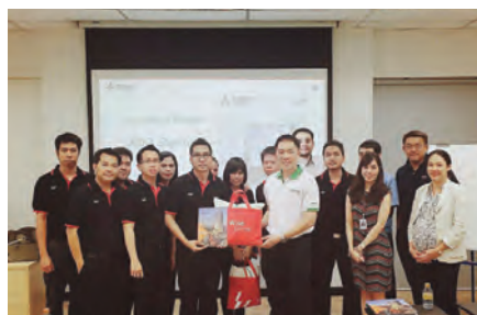
เยี่ยมชมศูนย์ Training Center