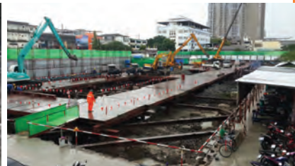
▶ ภาพรวมงานก่อสร้างโครงการ