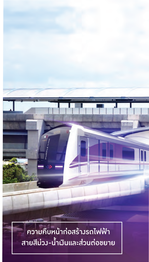
ความคืบหน้าก่อสร้างรถไฟฟ้าสายสีม่วง-น้ำเงินและส่วนต่อขยาย