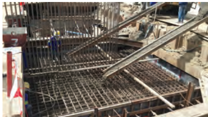
▶ งานเทคอนกรีตโครงสร้างฐานราก