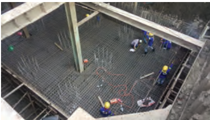
▶ งานลงเหล็กโครงสร้างฐานราก